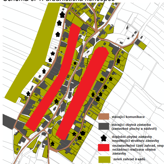
Schéma č. 1: urbanistická koncepce