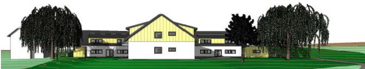
Vizualizace bytových domů v ploše BH č. 4

Účelem je regulovat zástavbu tak, aby navazovala na vesnický charakter okolní zástavby, což byl základní požadavek orgánu ochrany přírody (uplatnil stanovisko na základě ochrany krajinného rázu jako veřejného zájmu v souvislosti s § 12 zákona č. 144/1992 Sb., o ochraně přírody a krajiny, v platném znění). Zástavba svým objemovým měřítkem naváže na okolní zástavbu, k zajištění odpovídajícího charakteru je požadována sedlová střecha se sklonem 35° - vše dle studie z ledna 2023 (P&R AIR s.r.o.). Navrhují se tři tvarově a velikostně totožné domy, které jsou nepravidelně uspořádány na daném pozemku.